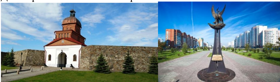
2. Достопримечательности Новокузнецка 1 балл