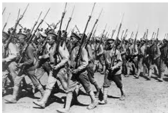
Фото 2 Армия вчера.

( Демонстрируются фото армии прошлых лет и настоящего времени.)