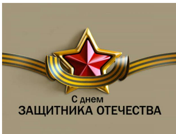
Фото 1. День защитника Отечества.

23 февраля в России отмечается День защитника Отечества.