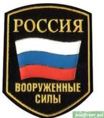
Фото 6. Вооруженные силы России.

Ведущий. Предлагаю собрать пазлы. Можно разделить группу на команды или пригласить двух желающих. Раздаются пазлы. Ребята собирают. Результат демонстрируется на фото. Так выглядит общий атрибут вооруженных сил России.