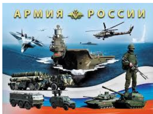
Фото 5. Армия России.

Ведущий. Предлагаю собрать пазлы. Можно разделить группу на команды или пригласить двух желающих. Раздаются пазлы. Ребята собирают. Результат демонстрируется на фото. Так выглядит общий атрибут вооруженных сил России.