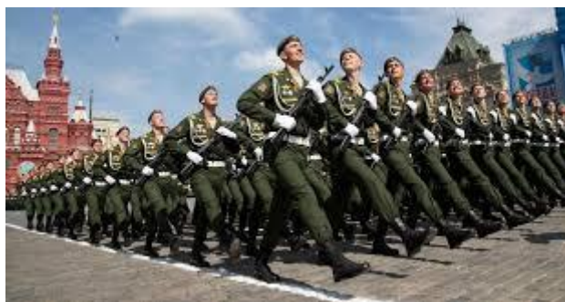
Фото 3. Армия сегодня.

Ведущий. А знаете ли вы, ребята, сколько человек в российской армии?